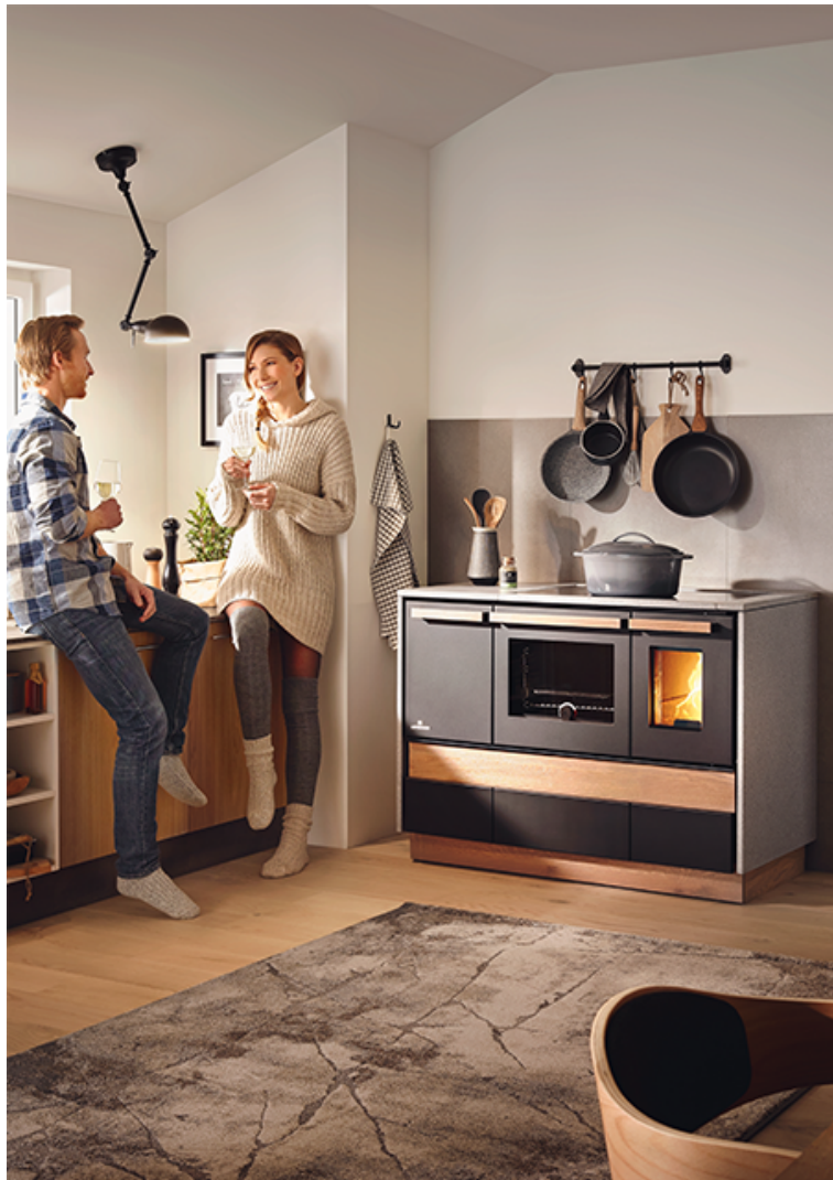
Appareil sur pied sans étuve