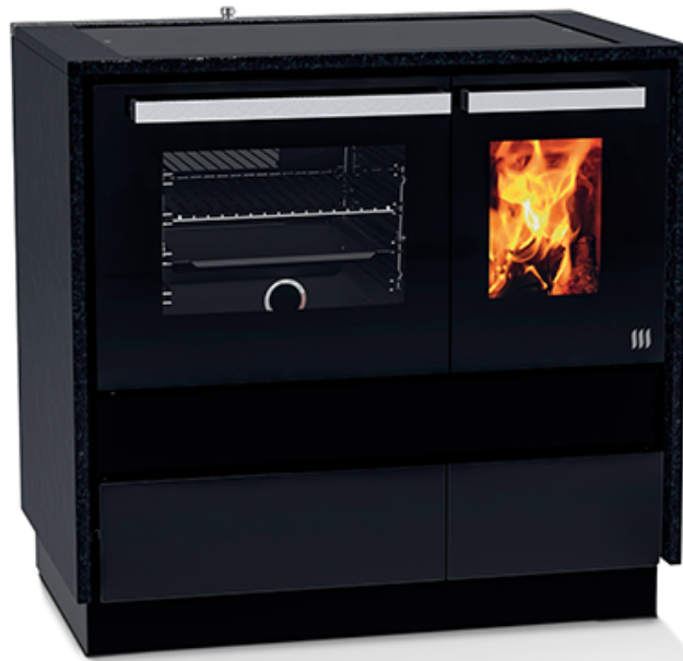
Appareil sur pied sans étuve